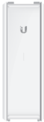
UniFi Cloud Key

Antes de comenzar la configuración del dispositivo UC-CK es necesario revisar el contenido de la caja o paquete, a continuación, se ilustra lo que contiene.