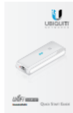
Quick Start Guide

Para realizar la configuración de nuestro dispositivo UC-CK se recomienda utilizar los siguientes buscadores Web.